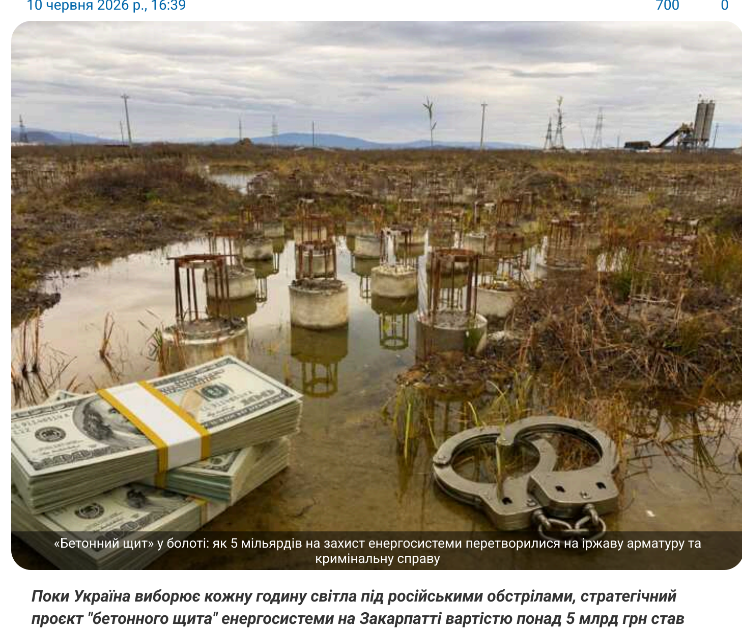
«Бетонний щит» у болоті: як 5 мільярдів на захист енергосистеми перетворилися на іржаву арматуру та кримінальну справу

Поча Україна виборє кожну годину світла під російськими обстрілами, стратегічний проект «бетонного щита» енергосистеми на Закарпатті вартістю понад 5 млрд грн став об'єктом кримінального провадження. Те, що мало рятувати від «шахедів», за версією правоохоронців, перетворилося на чергову «золоту жинку» для обрання.