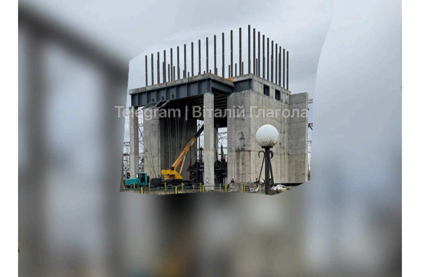
Вимірний вигляд об'єкту

На третьому кадрі посеред поля височіє єдина самотня бетонна коробка – капонір для автотрансформатора. Зверху на конструкції так само стирчать огнені металеві шпери арматури, а в середині недобудови просто в калюжі іржаві забутий кран.