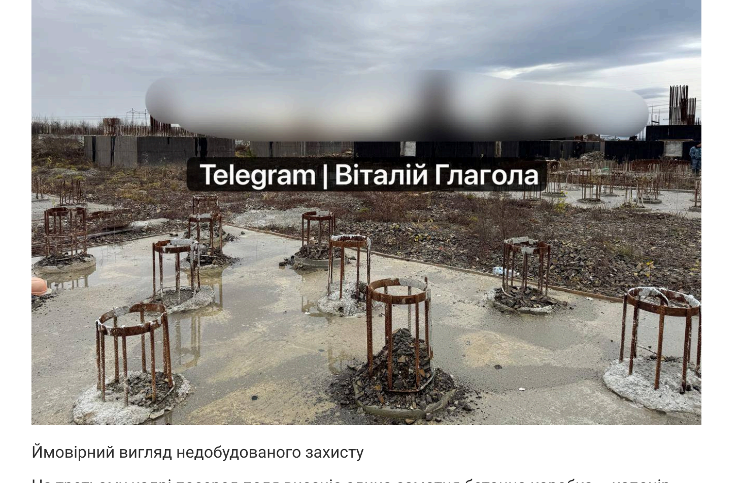
Вимірний вигляд недобудованого захисту

Інша світлина зафіксувала ряди бетонних «склянок» для опорних колон. З них стирчить арматура, яка за час простою під відкритим небом покрилась іржею і почала заростати густим очеретом.