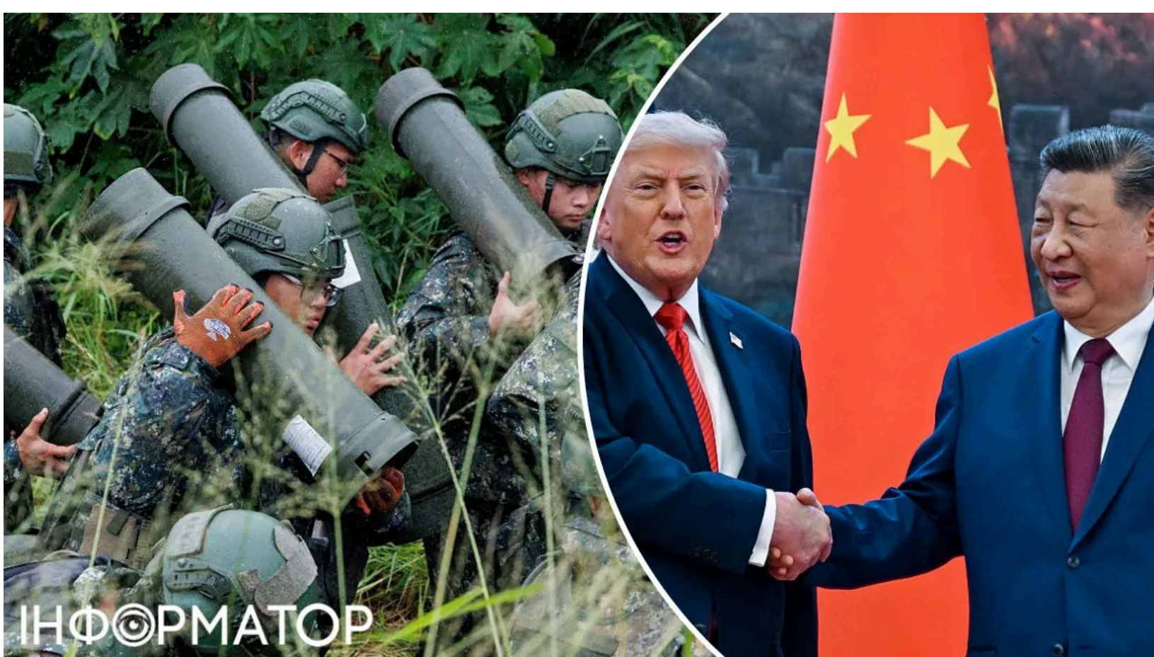
Армія Тайваню проводить навчання на тлі зближення США та Китаю

Лідерка головної опозиційної партії Тайваню закликала Вашингтон і Пекін припинити торгуватися островом як звичайною розмінною монетою. Заява пролунала за кілька тижнів після саміту Дональда Трампа та Сі Цзіньпіна - і відразу викликала резонанс по обидва боки Тихого океану. Особливої гостроти їй додала позиція самого Трампа, який після Пекіна публічно поставив під сумнів готовність США захищати острів і назвав продаж зброї Тайбею "козирем у переговорах" з Китаєм.