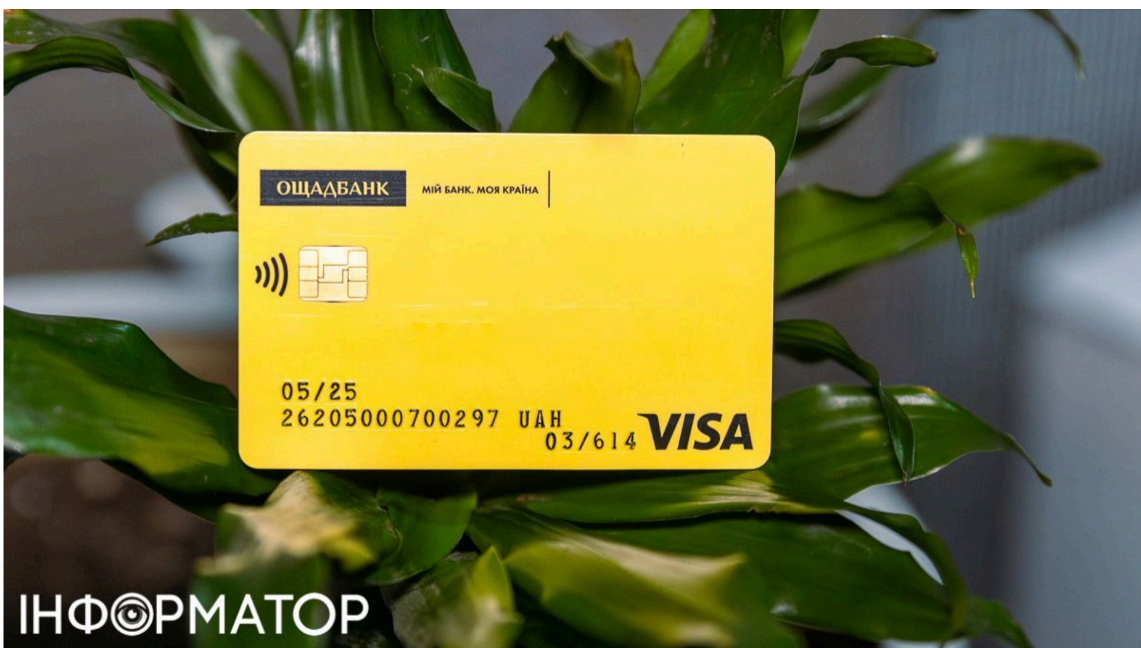
Картка Ощадбанку

Клієнти Ощадбанку все частіше виявляють, що їхні картки раптово перестають працювати, а гроші на рахунку стають недоступними. Банк масово блокує картки клієнтам, які перевищують встановлені ліміти на перекази - особливо операції з картки на картку. Раніше на сайті пояснювалося, як самостійно змінити ліміти на картковій операції - але тепер проблема вийшла на інший рівень. Законодавство дозволяє банку миттєво обмежити доступ до рахунку при виявленні підозрілої активності, а повідомлення клієнт отримує вже після застосування обмежень - через push або SMS.