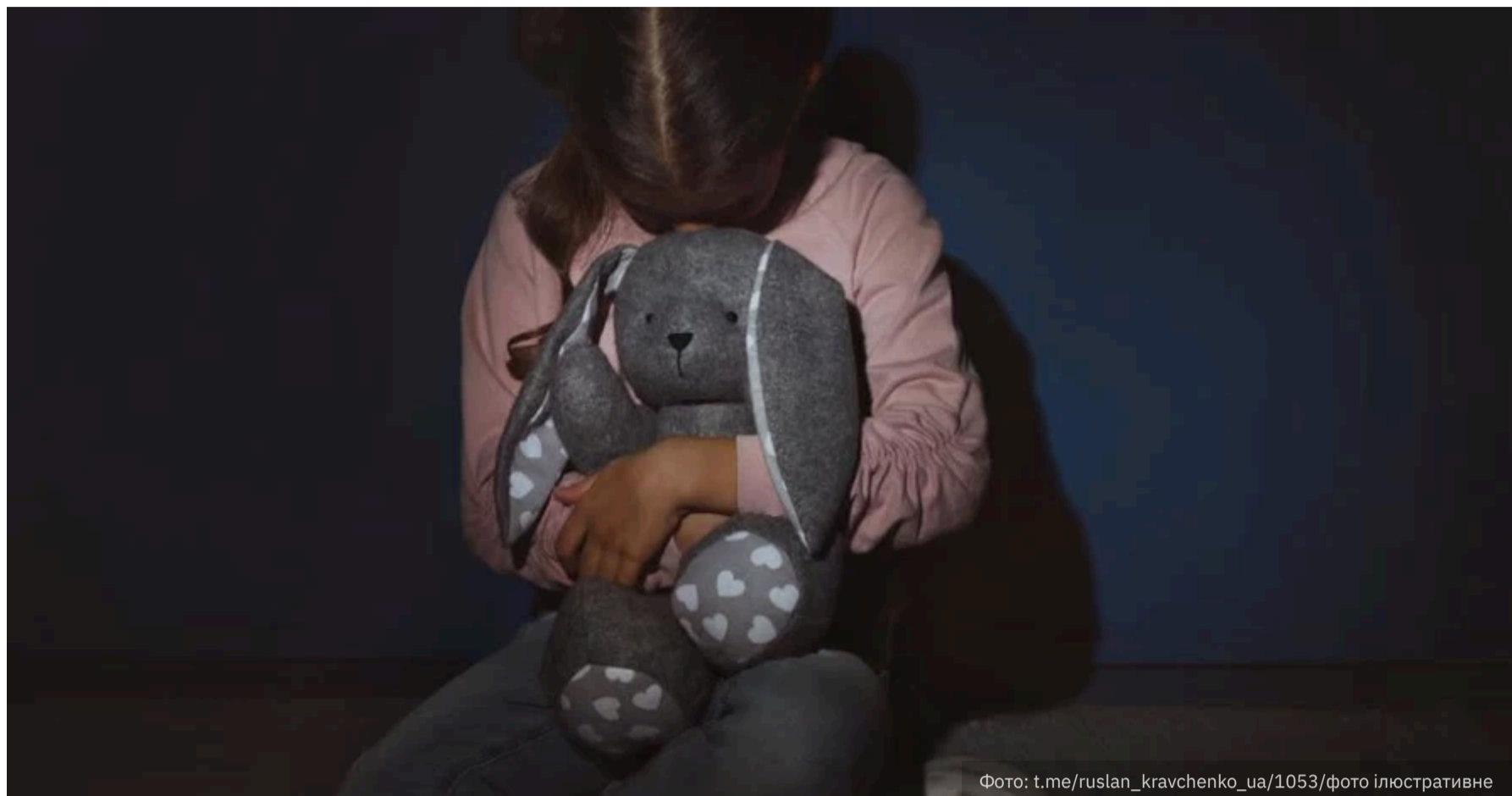
Фото: t.me/ruslan_kravchenko_ua/1053/фото ілюстративне

Вітчм, який протягом восьми місяців ґвалтував 11-річну дівчинку, отримав довічне позбавлення волі. Дівчинка – рідна донька героя України, який загинув на фронті захищаючи державу. У цій справі прокурори Харківщини довели шість епізодів злочину. Про це повідомляє Офіс генерального прокурора.