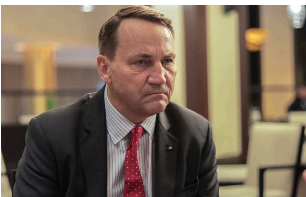
Фото: міністр закордонних справ Польщі Радослав Сікорський

Не витрачай час на шум! Читай тільки суть з РБК-Україна у Google