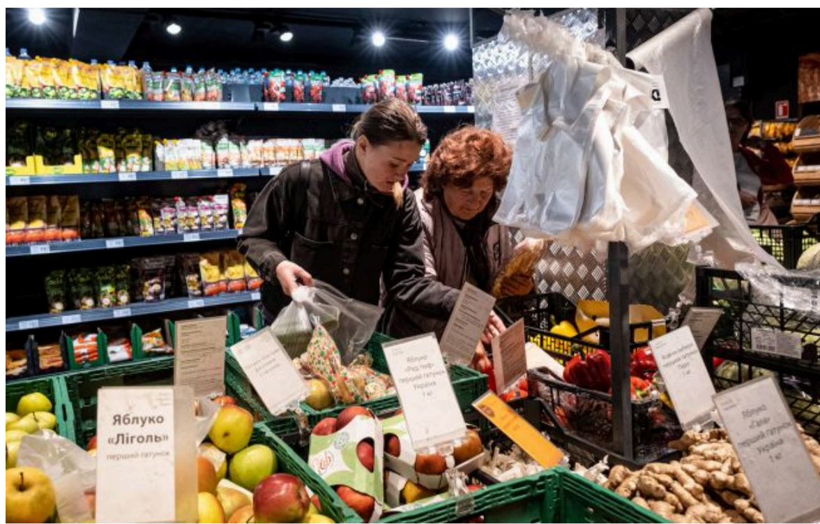
Фото: інфляція в Україні сповільнилася, проте українці й надалі відчувають зростання цін у магазинах (Getty Images)