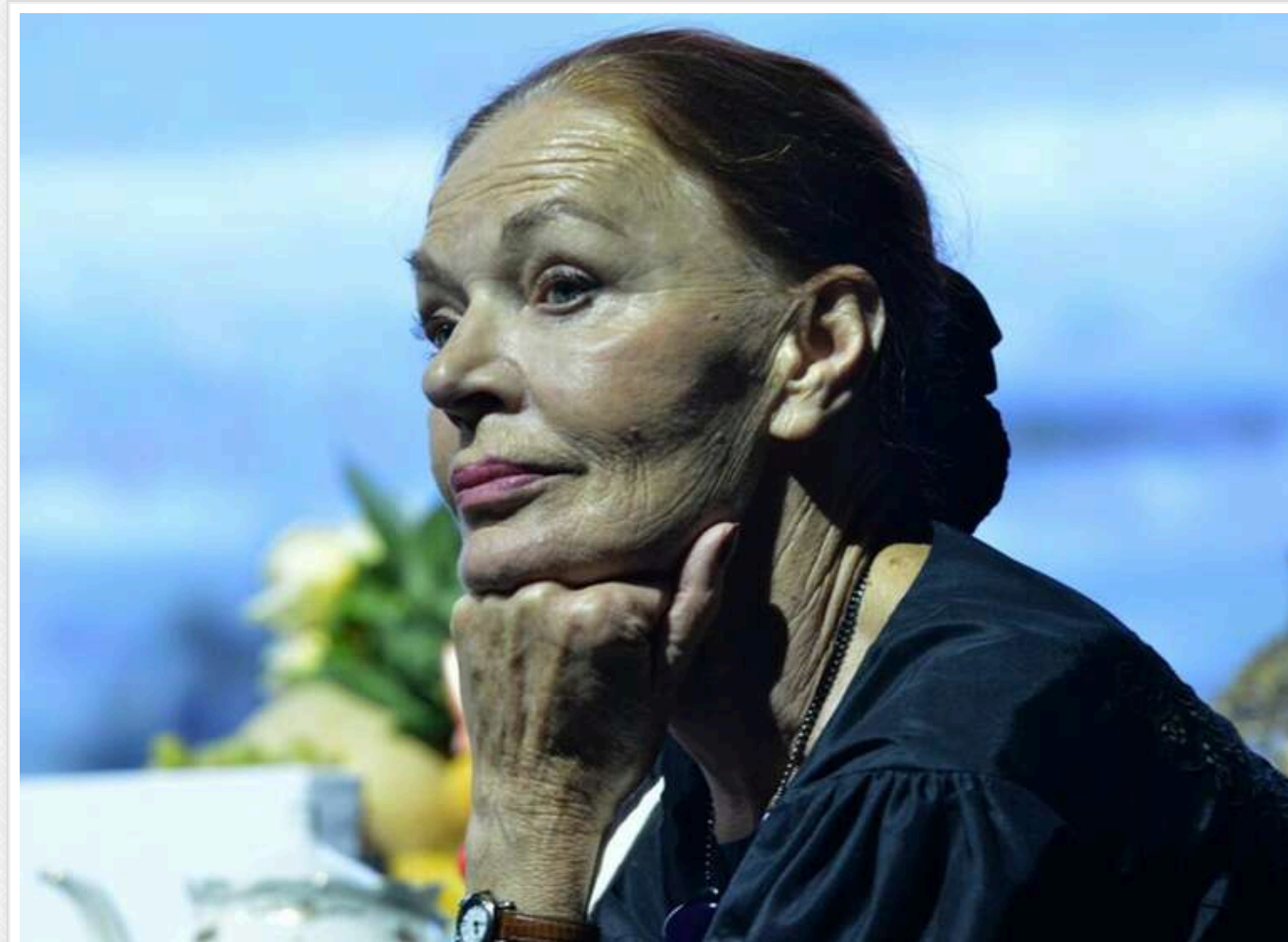
У віці 84 років померла затята путіністка та зірка радянського кіно Людмила Чурсіна

У віці 84 років пішла з життя російська акторка Людмила Чурсіна, відома роллю Марини Кисегач у серіалі «Інтерни». Серце «легенди» радянського кіно та прихильниці агресивної політики Кремля зупинилося після тривалої хвороби.