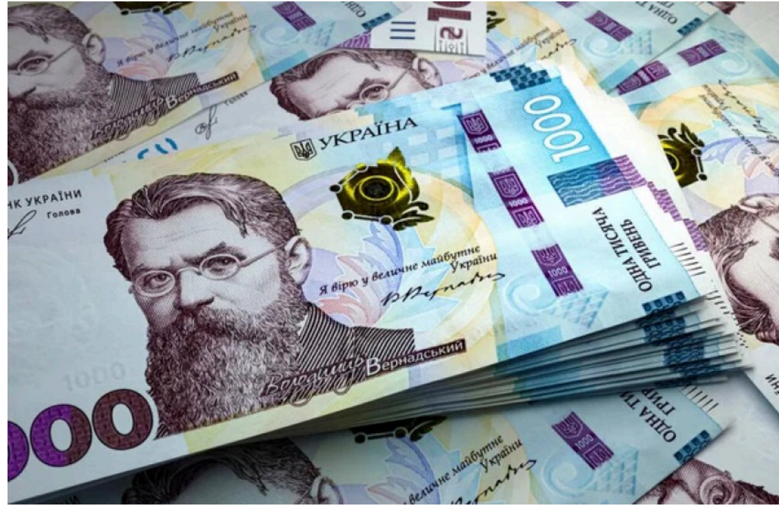
Мінекономіки запустить кредити під 0% для бізнесу / Урядовий портал

Українські підприємства, які зазнали збитків через війну, зможуть залучити до 150 млн грн пільгового фінансування. Новий напрям державної програми "Доступні кредити 5-7-9%" передбачає кредитування під 0% у перші два роки та покликаний допомогти бізнесу швидше відновити виробництво.