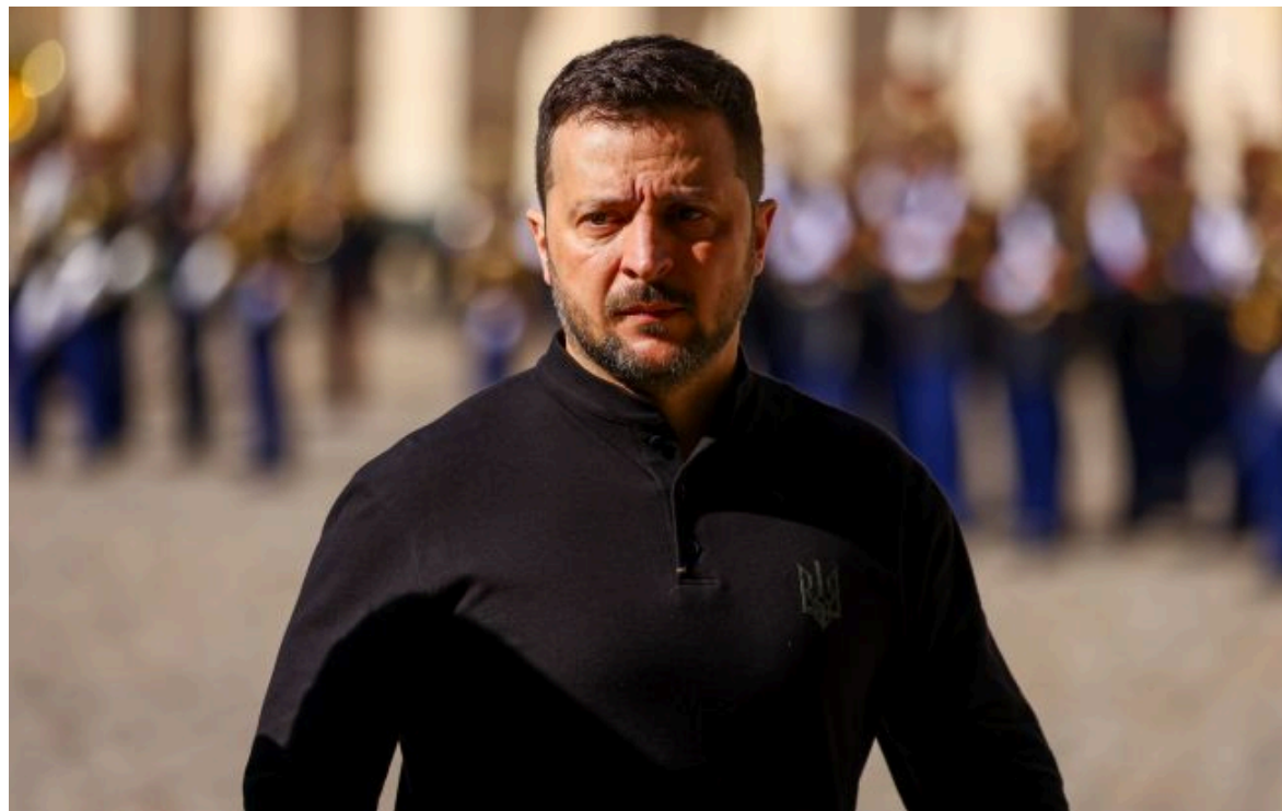
Фото: Володимир Зеленський (Gettyimages)