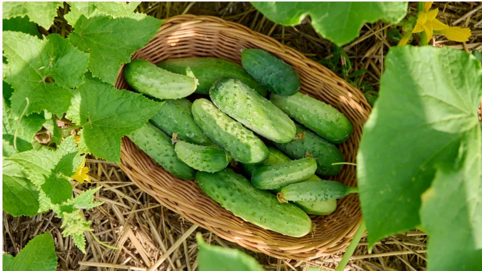
Огіркам під час зберігання потрібен доступ повітря

10 червня, 14.47 🗨️ Этот материал также можно прочитать на русском