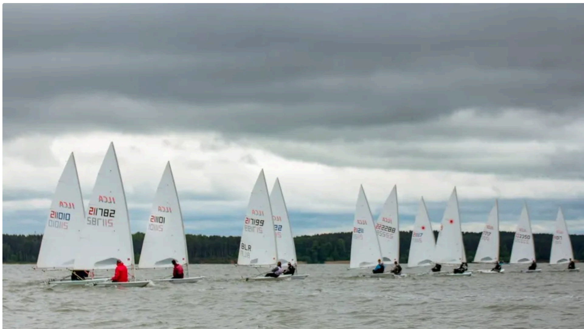
Із 2025 року білоруських і російських яхтсменів допускали до змагань лише в "нейтральному" статусі

10 червня, 14.30 Етот материал также можно прочитать на русском