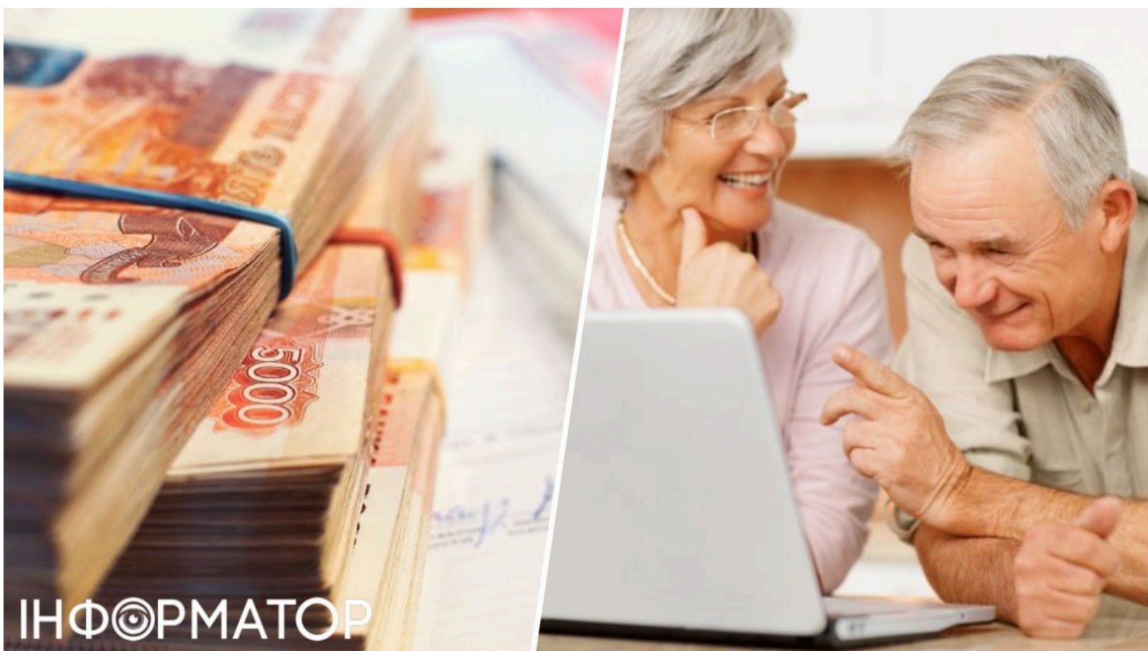
РФ ще ніколи не відчувала такого гострого дефіциту робочої сили.

Кремль знайшов черговий спосіб "вирішити" проблеми власноруч зруйнованої економіки - тепер на латання дір у ринку праці кинуть людей похилого віку. Раніше окупанти на Донеччині вдавалися до чергових маніпуляцій заради утримання контролю над підконтрольними територіями. Тепер тероризуються і власних громадян - тих, хто дожив до пенсії. Роки агресивної війни вибили з ринку праці мільйони чоловіків, і тепер система просить відпрацювати за них літніх людей.