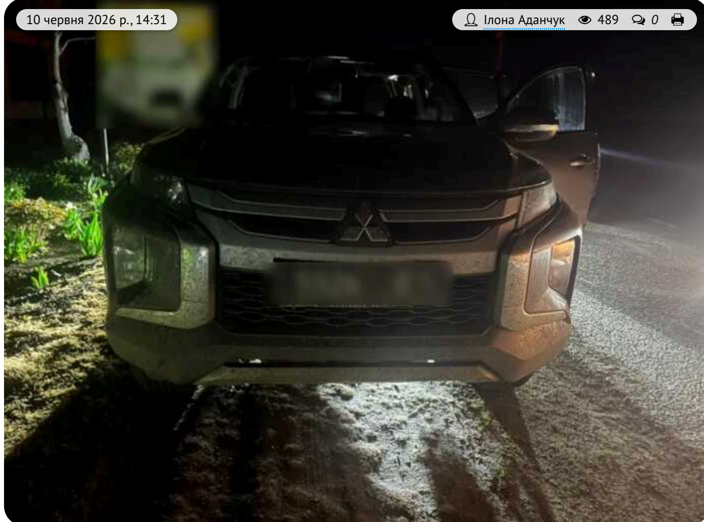
В Одесі викрили схему переправлення призовників за 13 000 доларів

Оперативники Одеського прикордонного загону спільно з СБУ та Нацполіцією заблокували ще один канал незаконного переправлення чоловіків призовного віку через державний кордон. Спецслужби затримали співорганізатора схеми та двох його спільників.