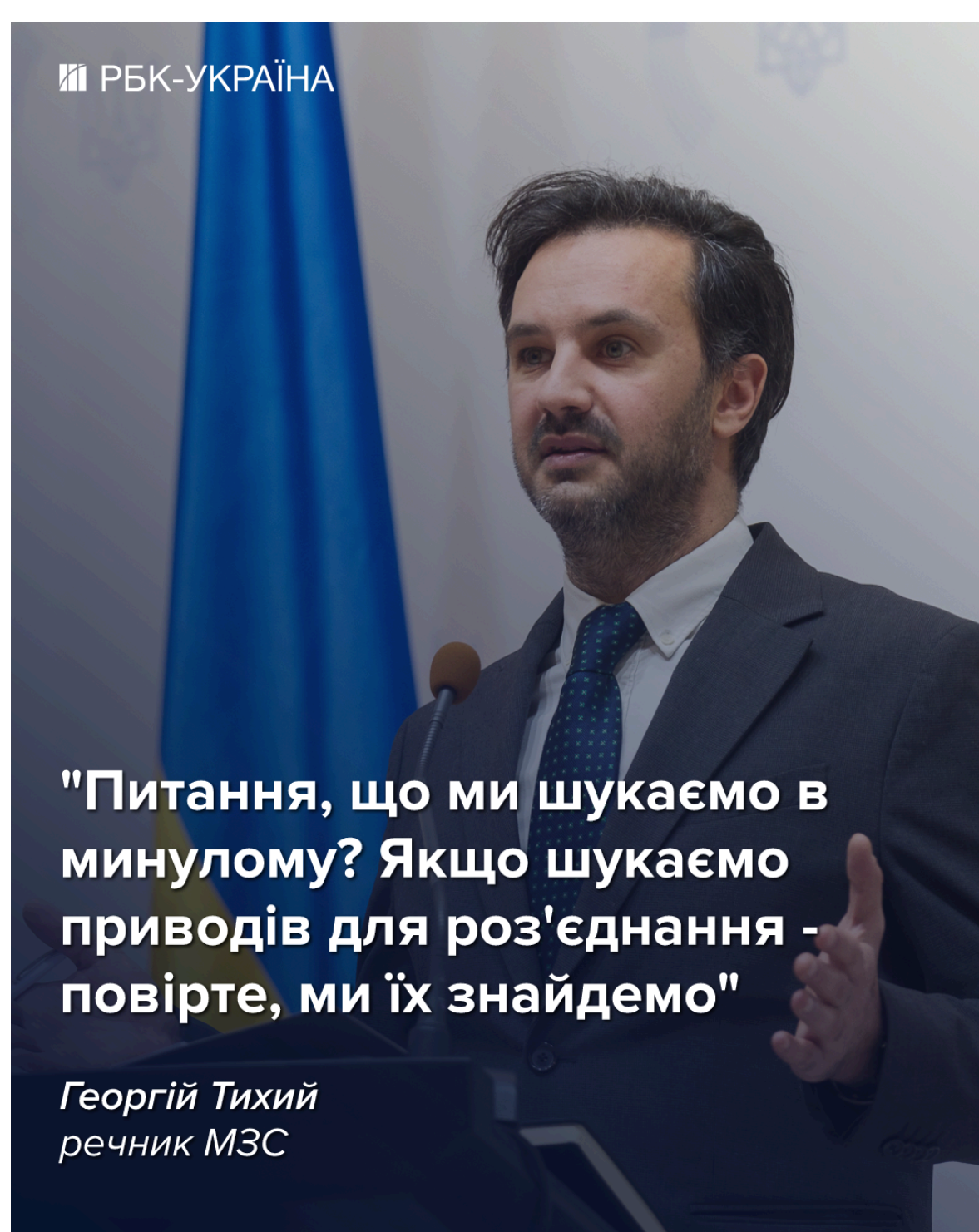
Фото: речник МЗС Георгій Тихий прокоментував скандал з УПА (інфографіка РБК-Україна)

"Питання, що ми шукаємо в минулому? Якщо шукаємо приводів для роз'єднання - повірте, ми їх знайдемо. Якщо шукаємо приводи для об'єднання протистояння спільному ворогу сьогодні - ми їх теж знайдемо. Ми хотіли б концентруватися, звісно, на другій частині", - зазначив Тихий.