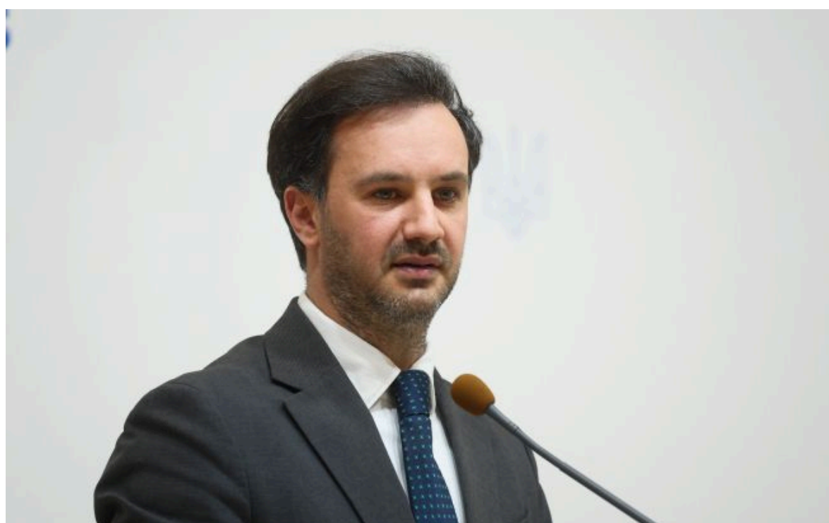
Фото: речник МЗС Георгій Тихий (Віталій Носач, РБК-Україна)

Не витрачай час на шум! Читай тільки суть з РБК-Україна у Google