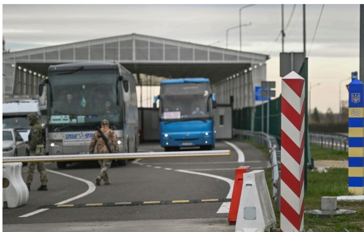
На кордоні з Польщею зростають черги

Не витрачай час на шум! Читай тільки суть з РБК-Україна у Google