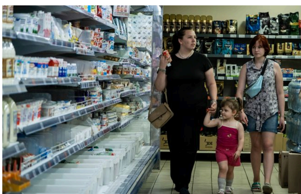
Фото: початок літа традиційно вносить корективи в споживчий кошук українців

Не витрачай час на шум! Читай тільки суть з РБК-Україна у Google