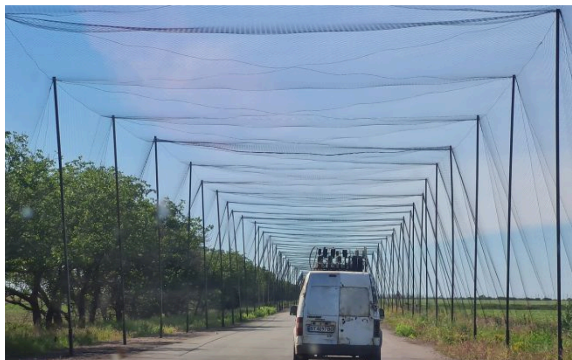
Фото: антидроновими сітками закриють дороги на Волині неподалік Білорусі