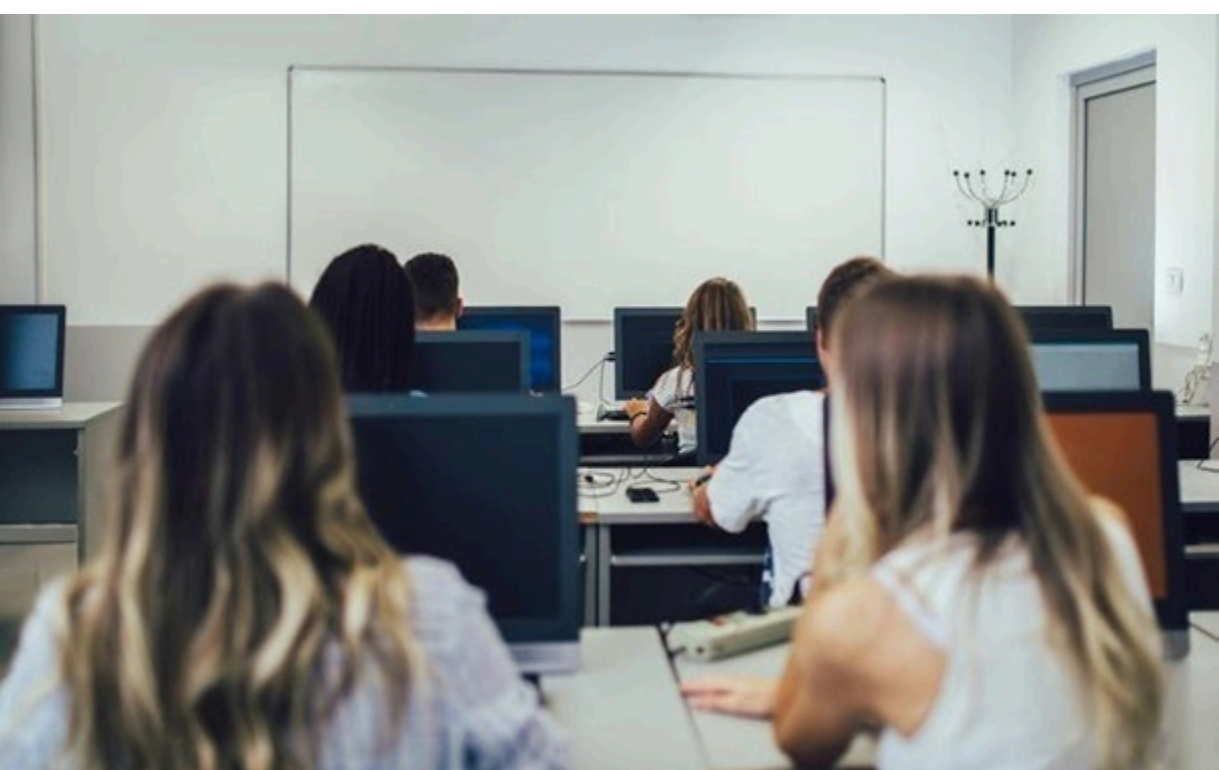
Фото: deroz/photos (ілюстраційне фото) Освітній омбудсмен розкритикувала виключення математики з НМТ

Омбудсмен вважає скасування НМТ з математики "шляхом до поразки", адже країні потрібні фахівці з аналітичним мисленням для оборонки та економіки.