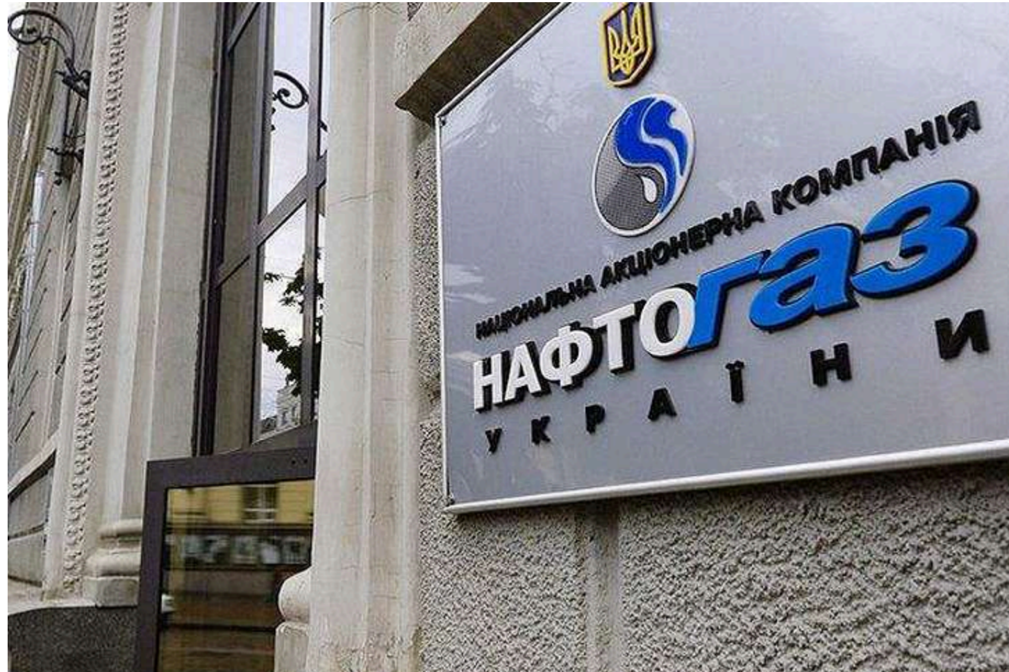
Иллюстративное фото из открытых источников