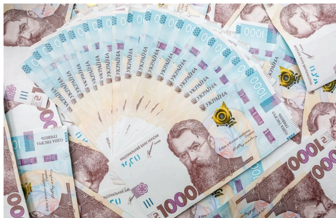
Пільги зі сплати митних платежів у травні склали 32,8 млрд грн

У травні 2026 року до державного бюджету надійшло 68,9 млрд грн митних платежів. Під час оформлення імпорту держава надала бізнесу та організаціям пільги на сплату мита на суму 32,8 млрд грн. Цей показник становить 47,6% від загальної суми коштів, які надійшли до бюджету від митниці.