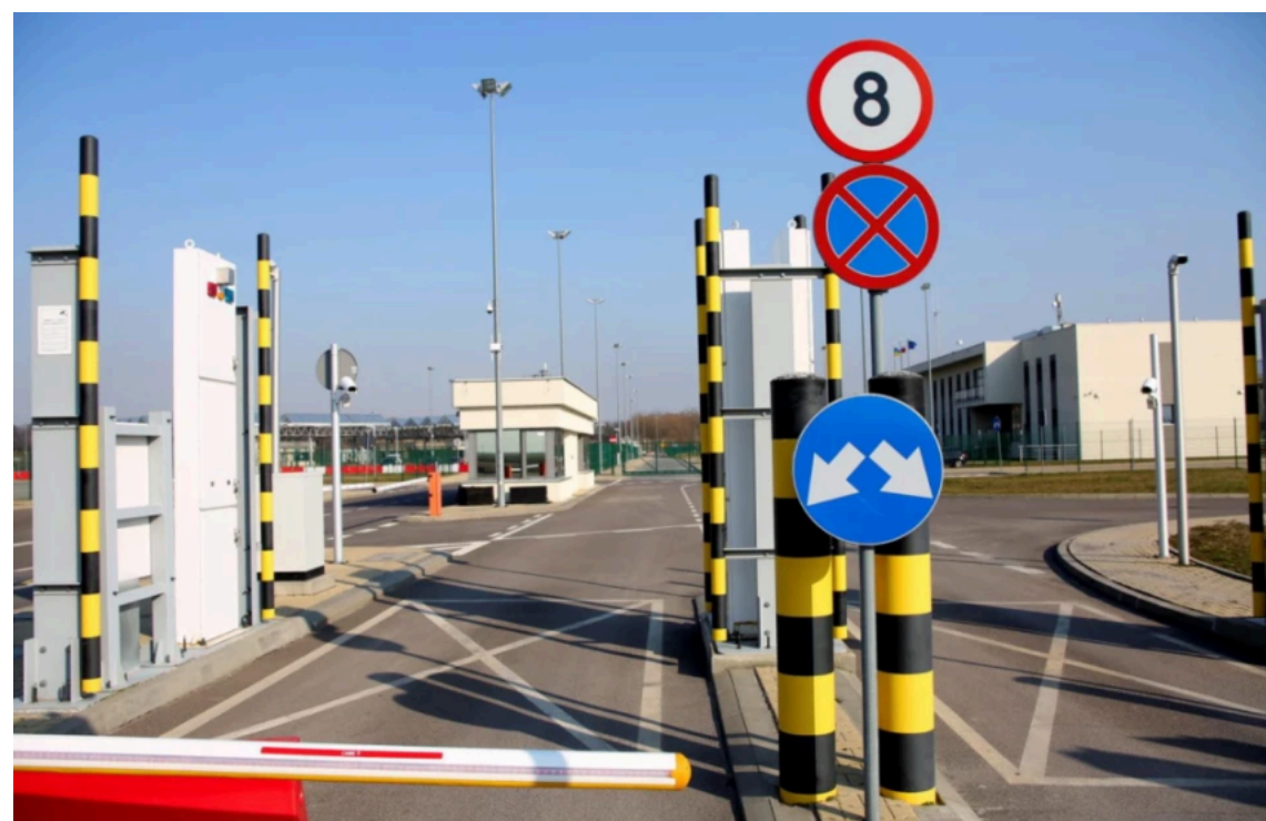
Чому утворилися черги на українсько-польському кордоні / Урядовий портал

На українсько-польському кордоні спостерігається накопичення транспортних засобів у напрямку виїзду з України. Найбільші черги зафіксовані на пунктах пропуску "Шегині", "Краківець" та "Рава-Руська".