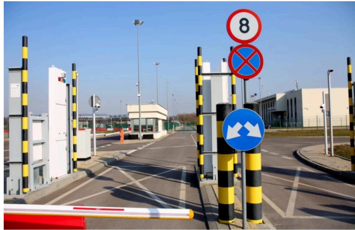
Чому утворилися черги на українсько-польському кордоні / Урядовий портал

На українсько-польському кордоні спостерігається накопичення транспортних засобів у напрямку виїзду з України. Найбільші черги зафіксовані на пунктах пропуску "Шегині", "Краківець" та "Рава-Руська".