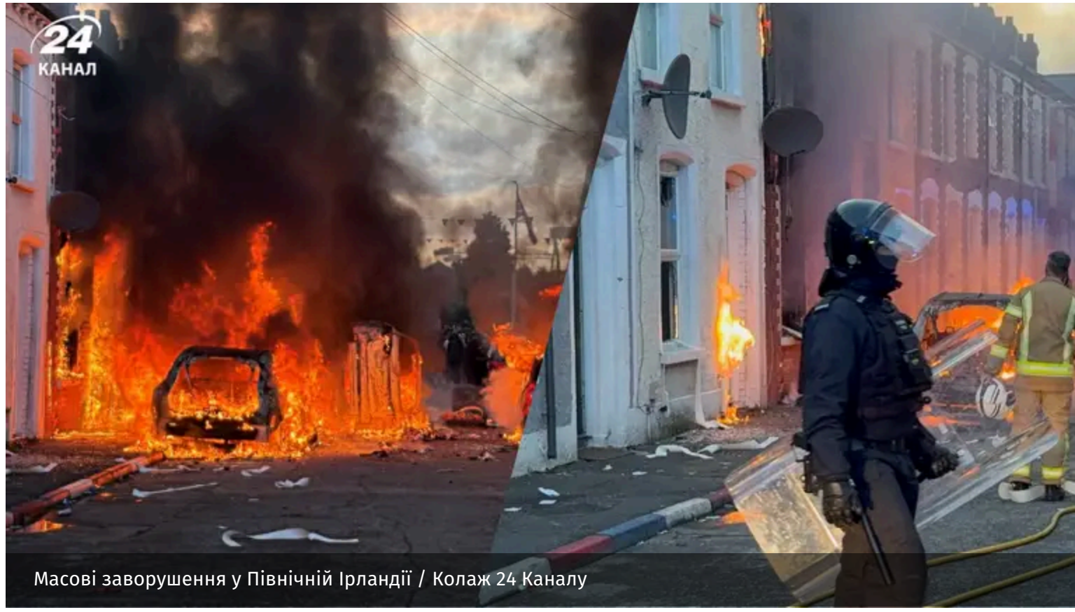
Масові заворушення у Північній Ірландії

У Белфасті, столиці Північної Ірландії, 8 червня мігрант скоїв напад з ножем на чоловіка. Після інциденту в низці міст люди вийшли на протест, подекуди почалися сутички.