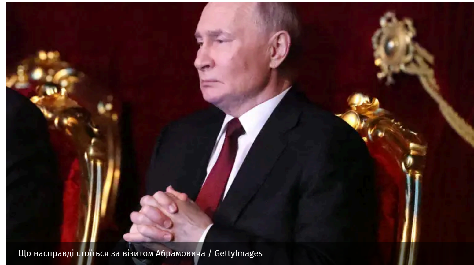
Що насправді стоїть за візитом Абрамовича

Приїзд Романа Абрамовича до Києва свідчить про глибоку недовіру російського диктатора до власних спецслужб та офіційних дипломатичних каналів. Водночас Кремль публічно демонструє войовничу риторику та вимагає від олігархів фінансування війни.