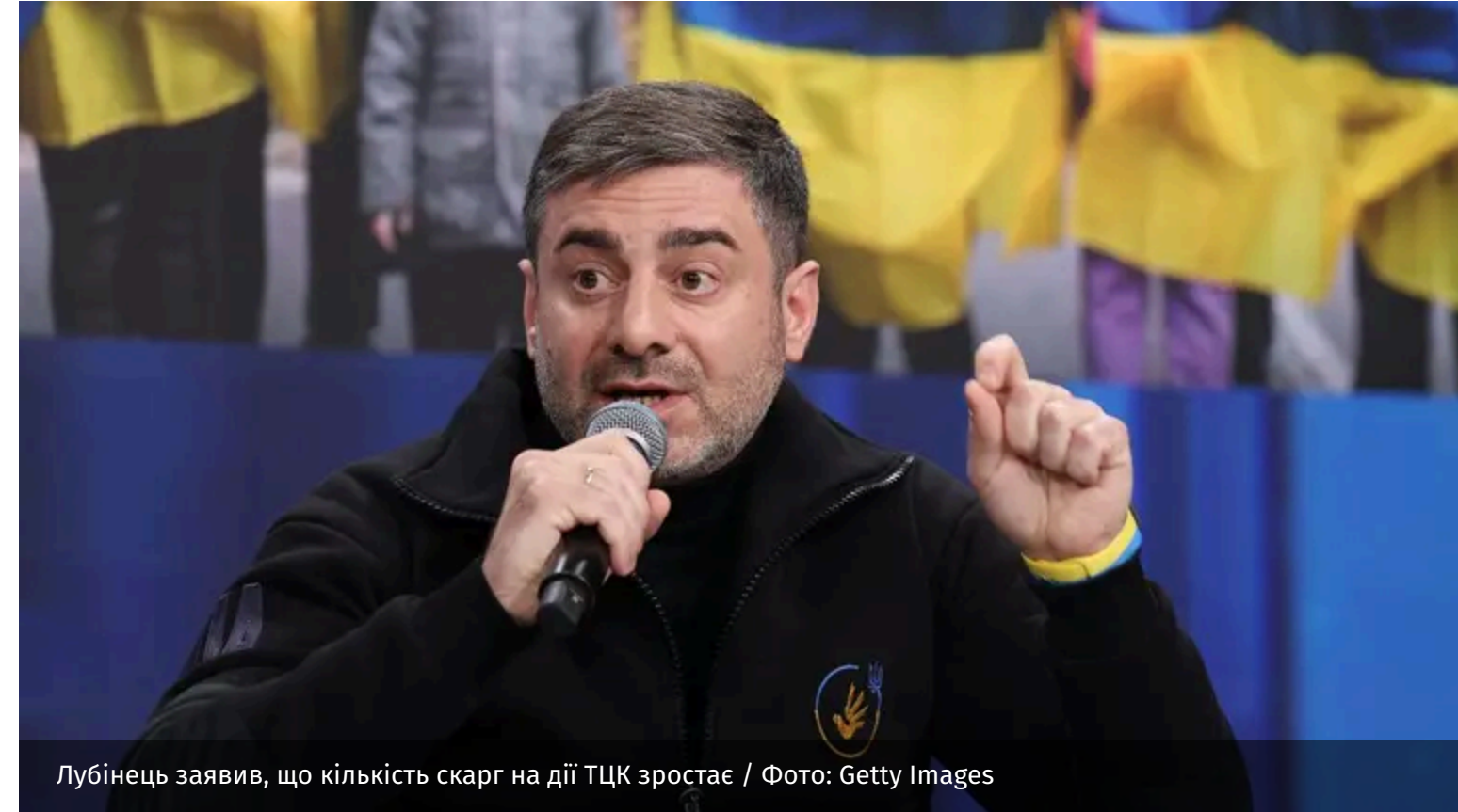
Лубінець заявив, що кількість скарг на дії ТЦК зростає

Від початку 2026 року до Офісу омбудсмана надійшло понад три тисячі скарг на дії військовослужбовців ТЦК. Водночас реальна кількість порушень є значно вищою.