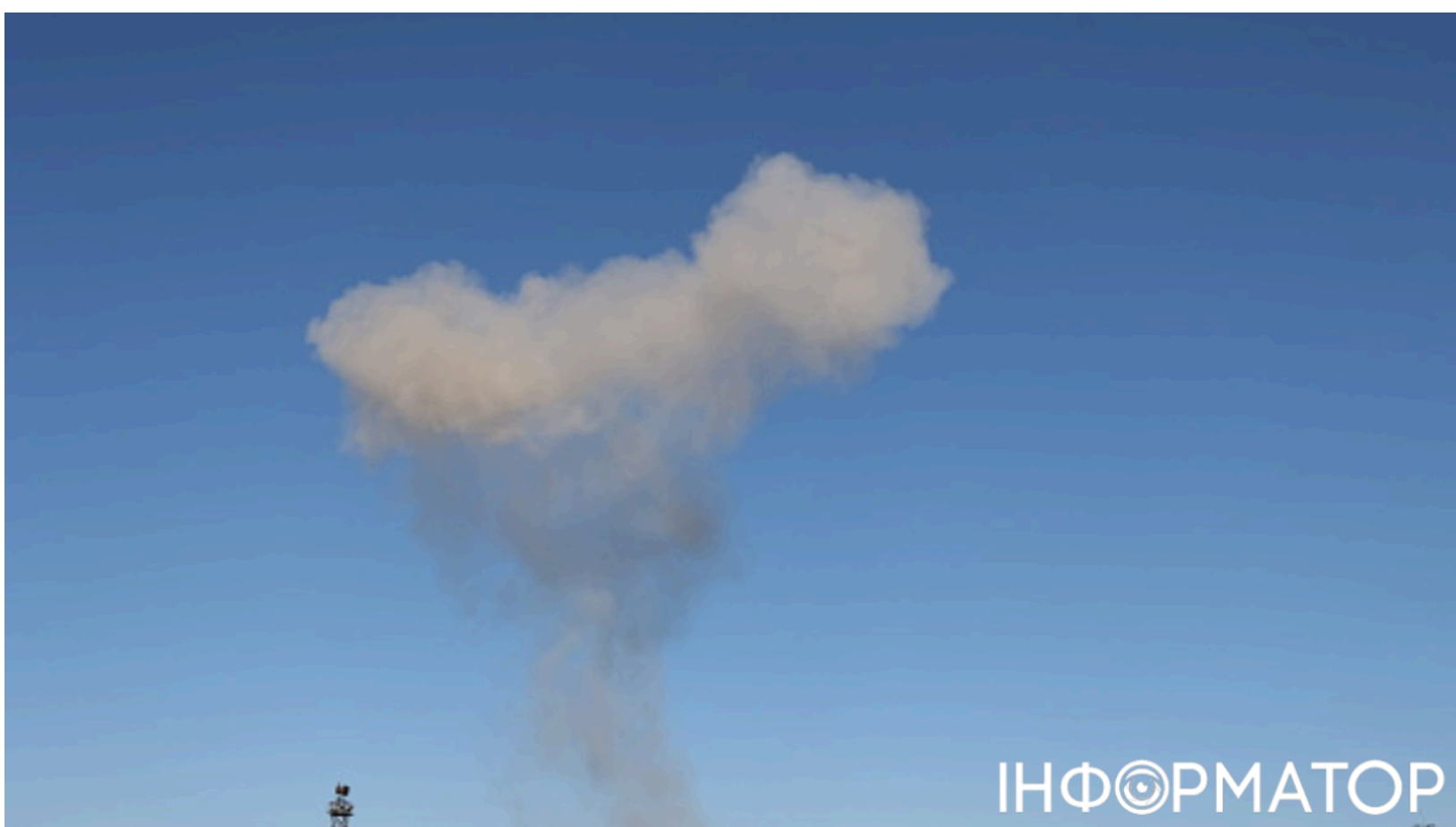
Сили оборони України продовжують атаки.

Сили оборони України завдали серії точних ударів по військово-промисловій та паливно-енергетичній інфраструктурі Росії в ніч проти 10 червня. Того ж дня росіяни в Чебоксарах і Самарі скаржилися на вибухи та пожежі на об'єктах. Серед цілей Сил оборони - ключовий виробник навігаційного обладнання для ракет і дронів, один із найбільших нафтопереробних заводів регіону та танкер тіньового флоту в Чорному морі.