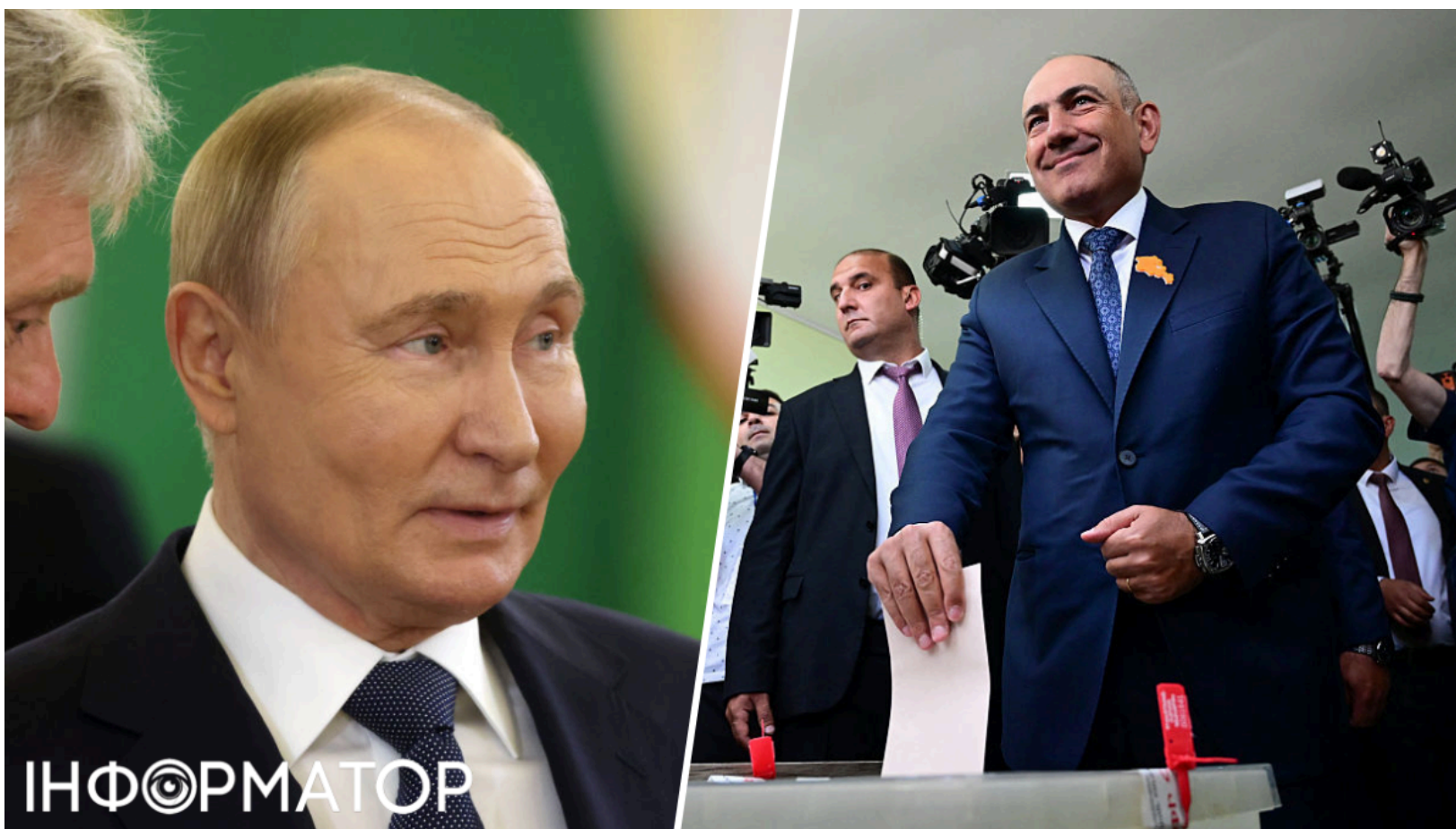
Путін вкрай розлючений перемогою Пашиняна на виборах.

Парламентські вибори, що відбулися у Вірменії 7 червня 2026 року, принесли перемогу проєвропейським силам. Курс чинного прем'єр-міністра Нікола Пашиняна отримав мандат довіри: його партія “Громадянський договір” здобула перемогу з результатом 49,81% голосів. Проросійські сили в особі блоку “Сильна Вірменія” (23,29%) не змогли змінити баланс сил на свою користь.