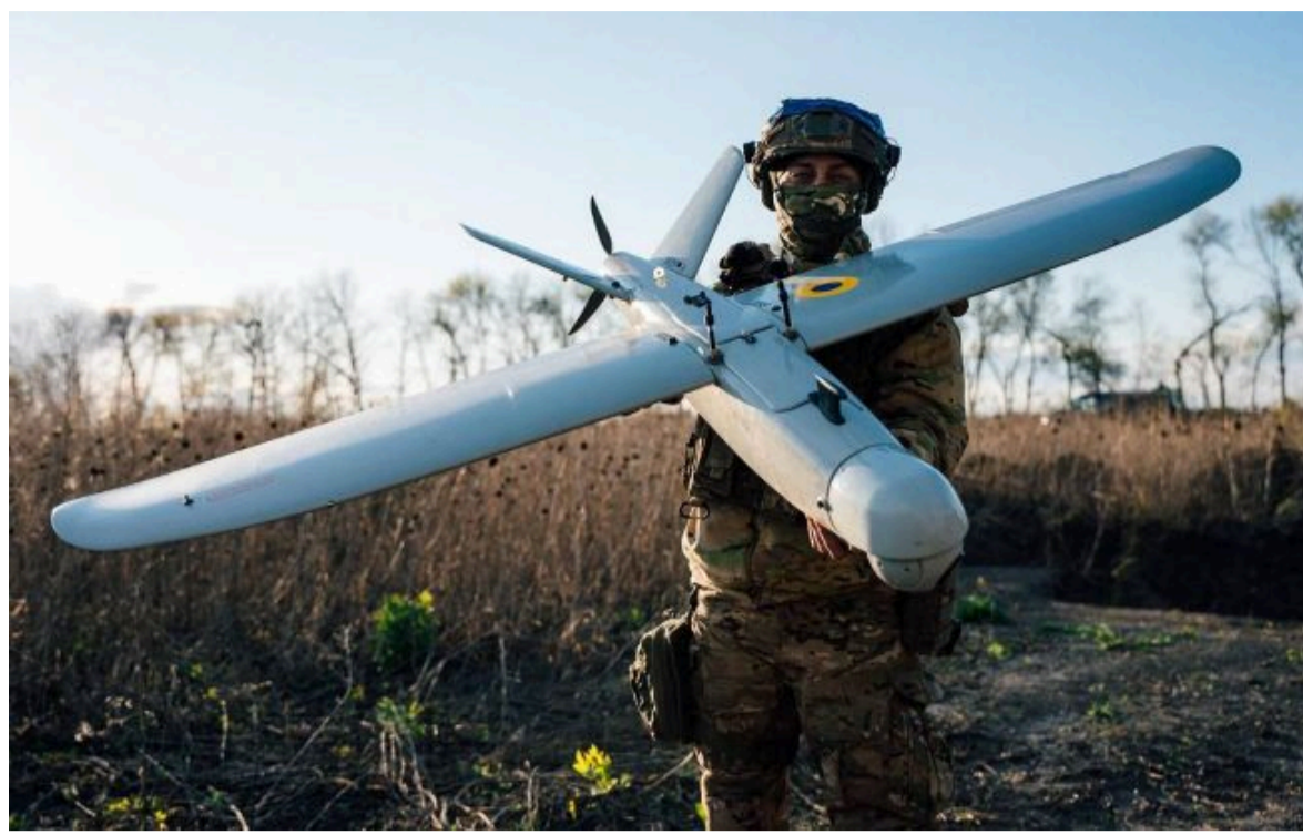
Фото: внаслідок ударів дронів палають нафтові резервуари на трьох об'єктах РФ (Getty Images)