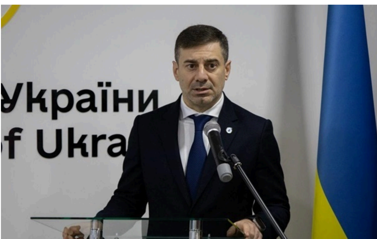
Уповноважений Верховної Ради з прав людини Дмитро Лубинець

3 січня по травень до Офісу омбудсмена надійшло понад 3000 скарг на дії військовослужбовців ТЦК.