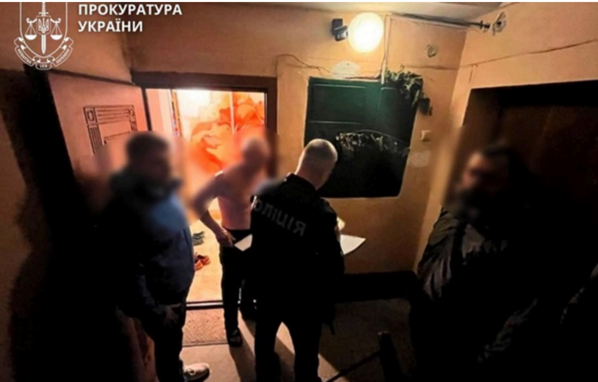
На Прикарпатті затримали чоловіка за сексуальне насильство над дітьми

Наразі відомо про двох потерпілих хлопчиків. На момент вчинення злочинів їм було 8 та 11 років.