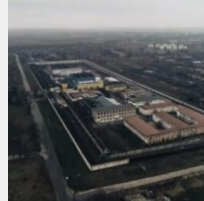
Російські загарбники перетворили Бердянську колоною № 77 на катівню для українців