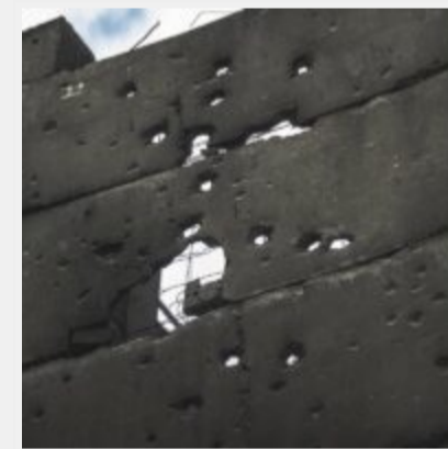
Як виглядає українська ТЕЦ, що пережила не одну ракетну атаку російських загарбників