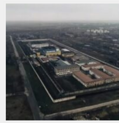
Російські загарбники перетворили Бердянську колонію № 77 на катівню для українців