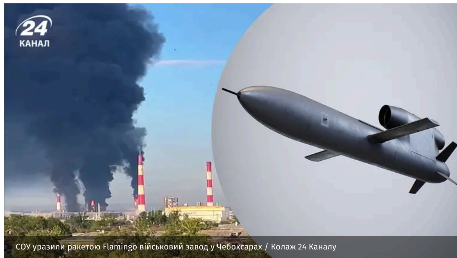
СОУ уразили ракетою Flamingo військовий завод у Чебоксарах

В ніч на 10 червня українські FP-5 "Фламінго" влучили у військовий завод "ВНДІР-Прогрес" у Чебоксарах. Він виготовляв компоненти для російських безпілотників і ракет. Цим ударом СОУ намагаються убезпечити українські тили.