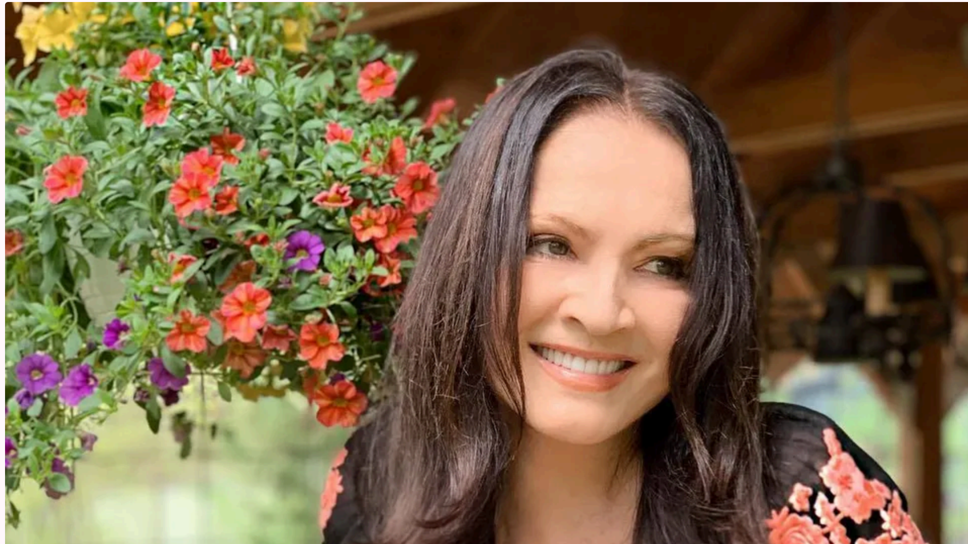
Ексдиректор співачки зазначив, що одного разу Коняхіна продала концерти Ротару на рік наперед, не поінформувавши його про це

10 червня, 11:55 🗣️ Цей матеріал також можна прочитати на руськом