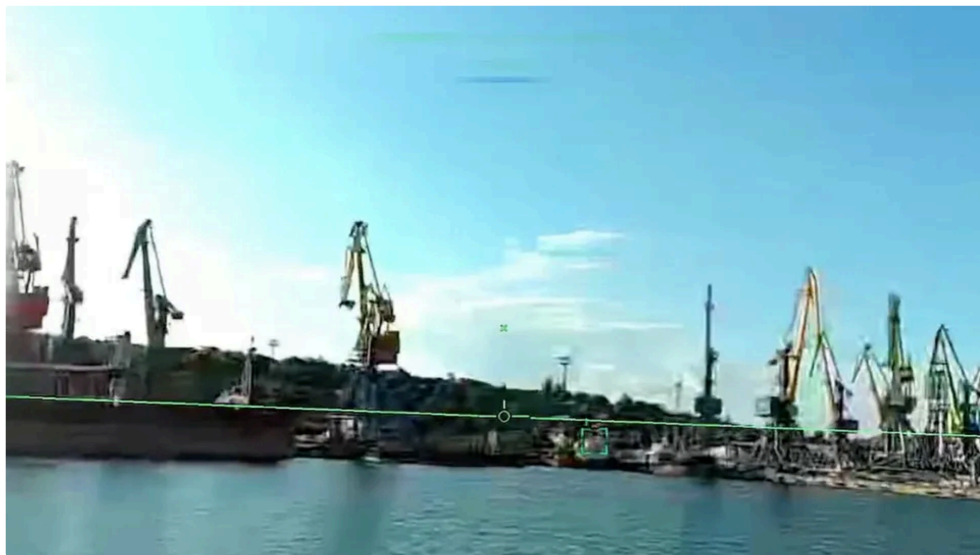
Маріупольський порт був одним із логістичних вузлів окупантів у Приазов'ї

10 червня, 12.47 🗨️ Цей матеріал також можна прочитати на руском