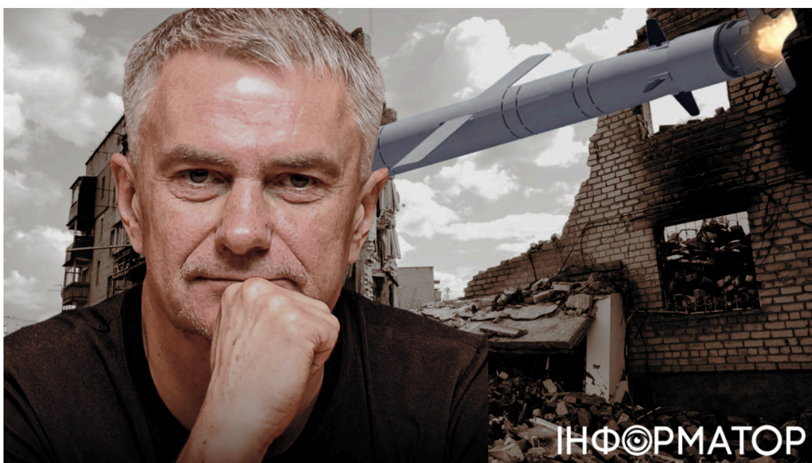
Боровик пояснив небезпеку Калібрів із касетною частиною

Росія готова застосувати модифіковані крилаті ракети "Калібр" із касетною бойовою частиною. І така зброя несе подвійну загрозу - вражає цивільне населення на великих площах, і залишає після себе нерозірвані суббоеприпаси. Про плани Росії оснащувати крилаті ракети касетними блоками попереджали ще раніше - тепер же деталі загрози пояснили практично.