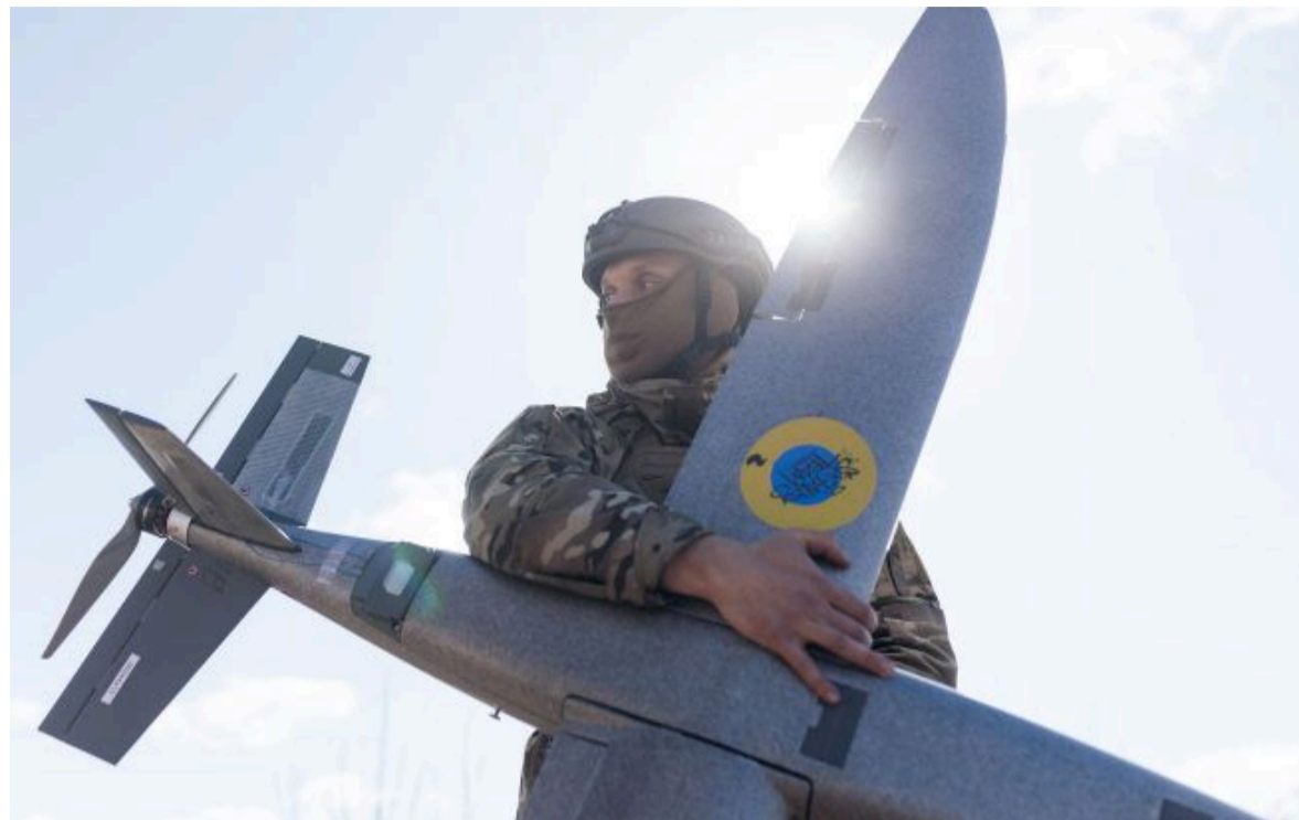
Фото: українські дрони знищили важливий для окупантів міст