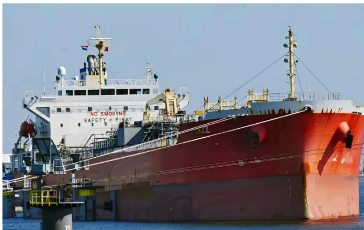
Фото: танкер WEST Horizon (war-sanctions.gur.gov.ua)