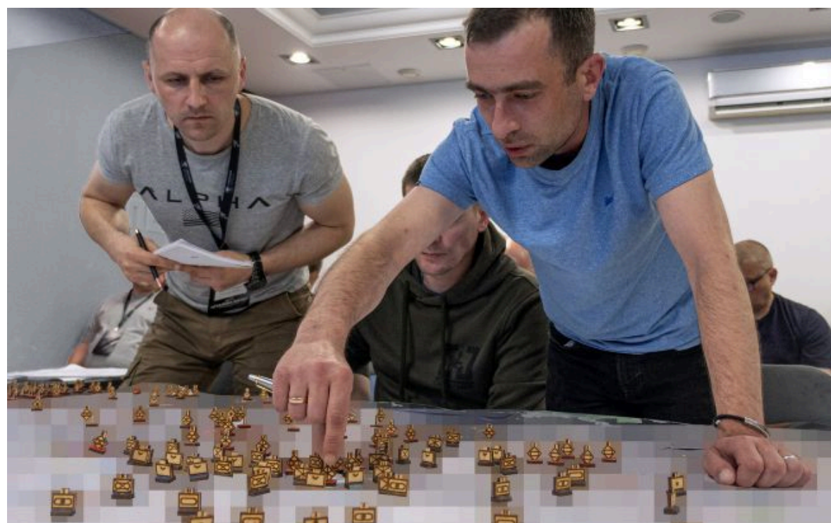
7 корпус ДШВ відпрацював сценарії боїв на Покровському напрямку