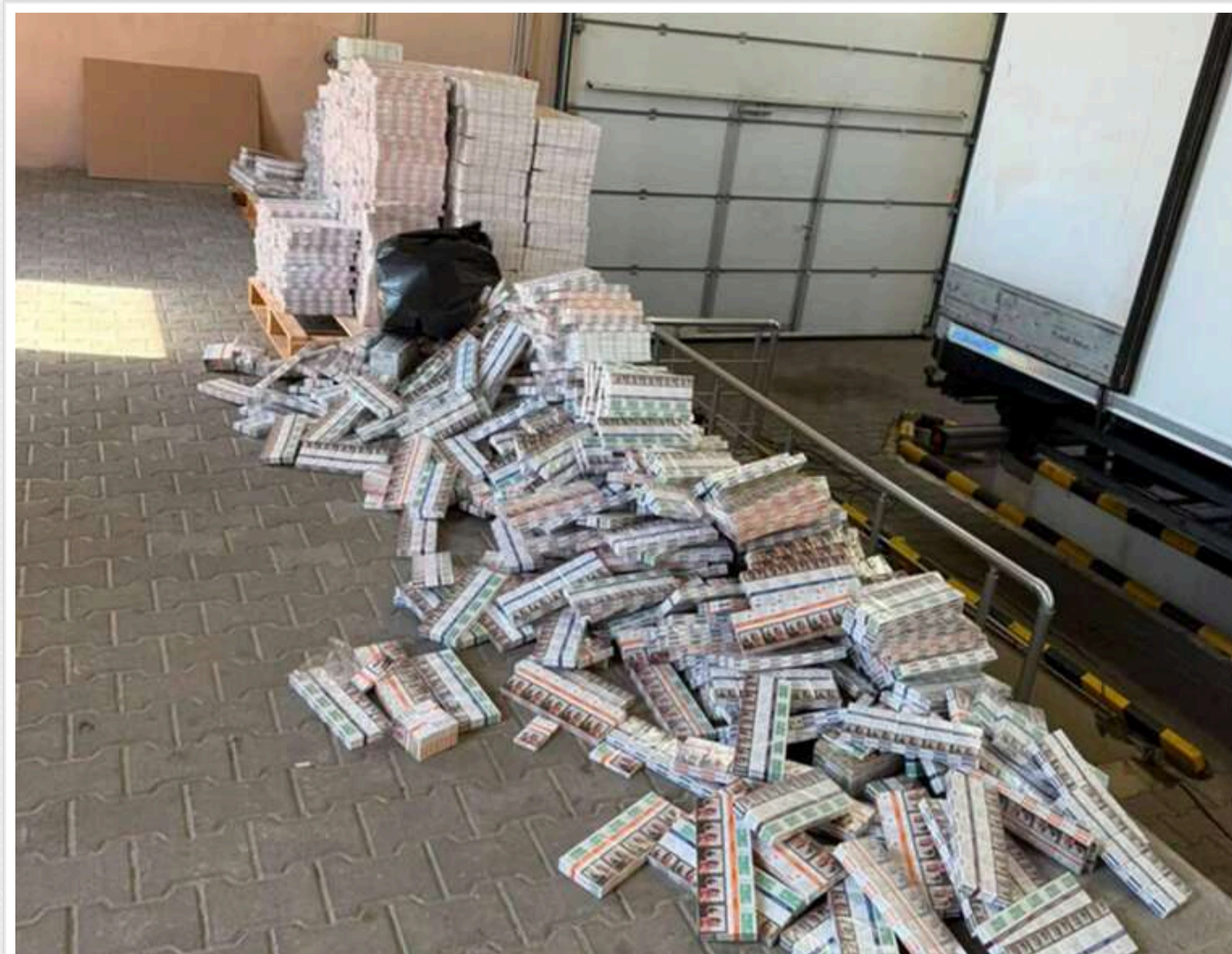
На Буковині митники вилучили приховані сигарети на суму близько 4 мільйонів гривень

Митники на Буковині виявили понад 31 тисячу пачок сигарет орієнтовною вартістю близько 4 млн грн.