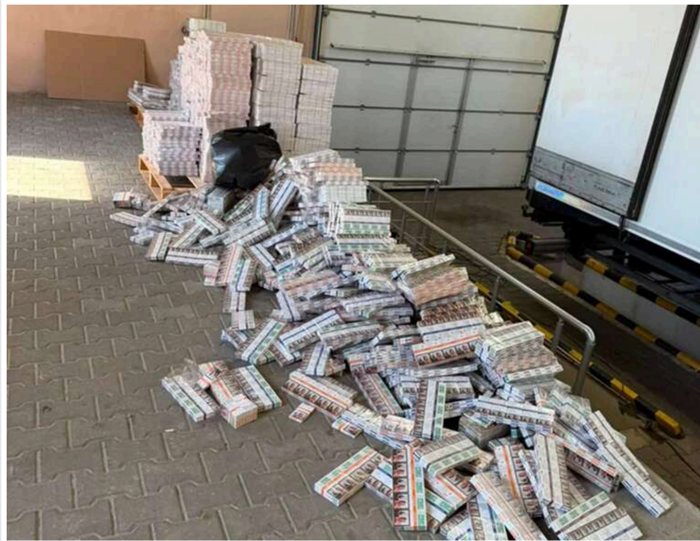
На Буковині митники вилучили приховані сигарети на суму близько 4 мільйонів гривень

Митники на Буковині виявили понад 31 тисячу пачок сигарет орієнтовною вартістю близько 4 млн грн.