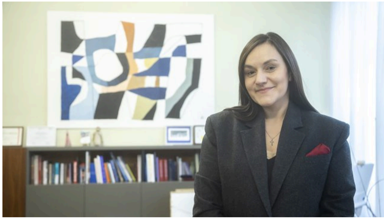
Тетяна Бережна, віцепрем'єр-міністр з питань гуманітарної політики, міністр культури України. 09.02.2025

Віцепрем'єр-міністерка з гуманітарної політики – міністерка культури України Тетяна Бережна вважає, що почесні звання в сфері культури варто залишити, але щоб вони не були інструментом дофінансування низьких заробітних плат.