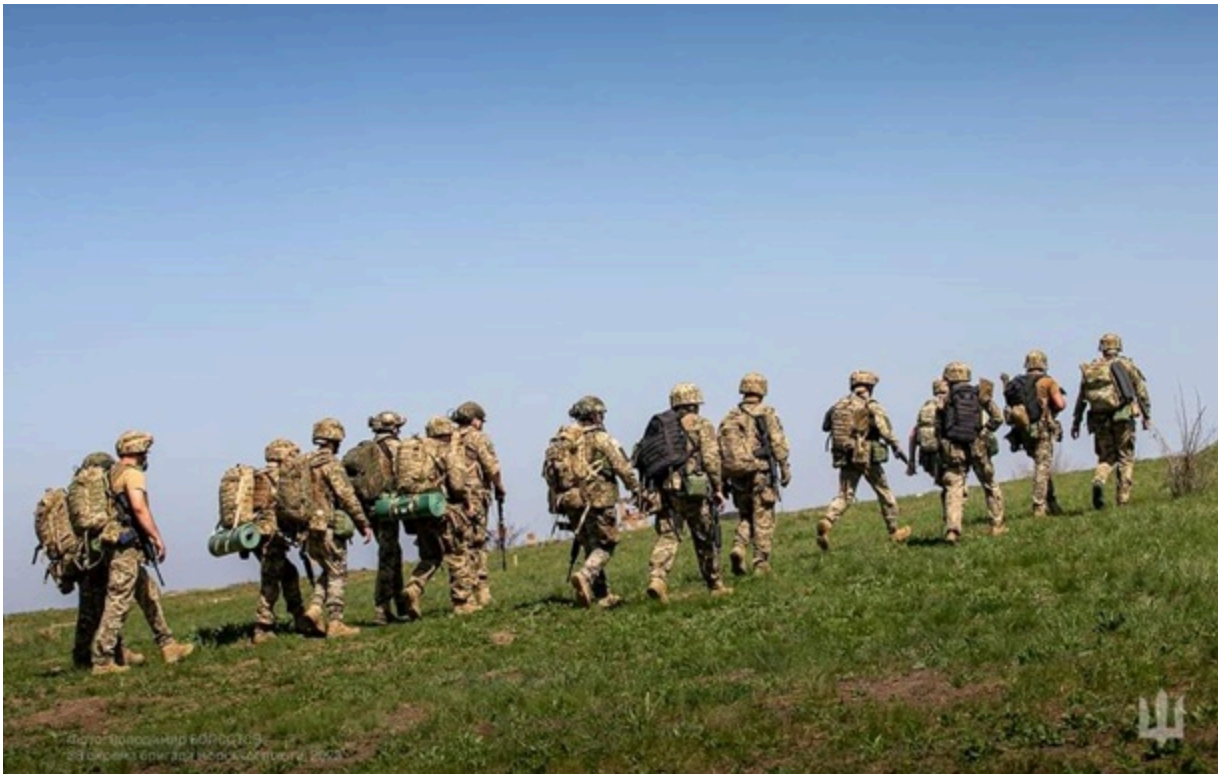
Україна витрачає мільярди доларів на оборону

Змінами передбачено, що доходи держбюджету-2026 зростуть на майже 2,3 трлн грн завдяки трьом джерелам.