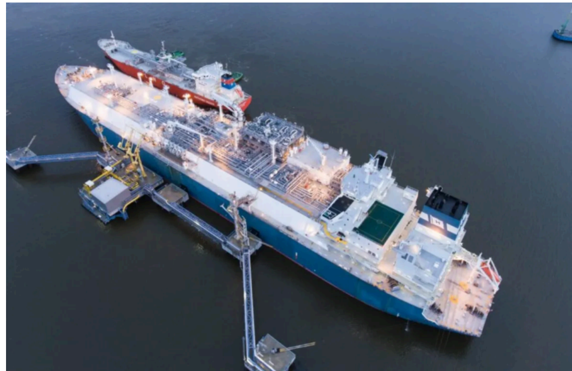
"Нафтогаз" вперше забронював довгострокові потужності LNG-терміналу в Клайпеді

Група "Нафтогаз" вперше забронювала довгострокові потужності з регазифікації зрідженого природного газу (LNG) в Європі. Йдеться про доступ до інфраструктури LNG-терміналу в Клайпеді (Литва) на період з 2033 до 2044 року.