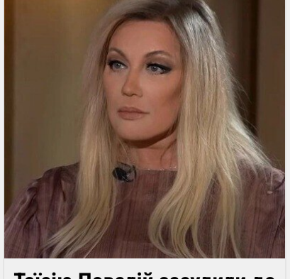
Таїсію Повалій засудили до ув'язнення і конфіскують майно