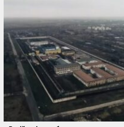
Російські загарбники перетворили Бердянську колонію № 77 на катівню для українців