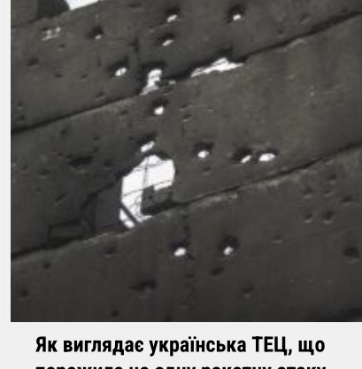
Як виглядає українська ТЕЦ, що пережила не одну ракетну атаку російських загарбників