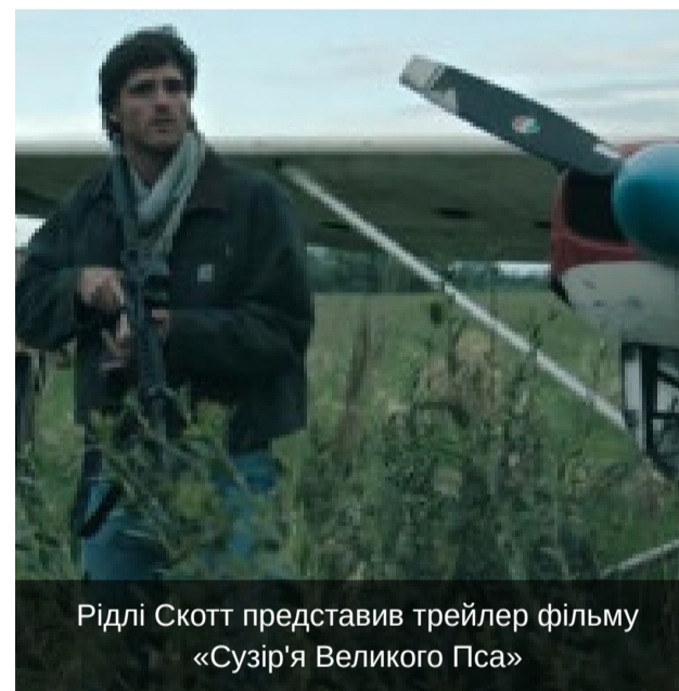
Фото та Відео

Рідлі Скотт представив трейлер фільму «Сузір'я Великого Пса»