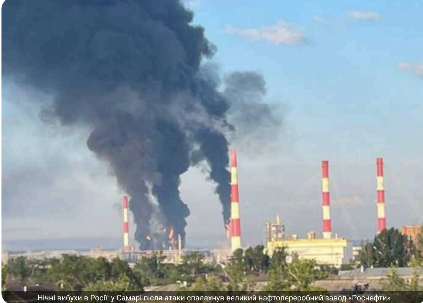
Нічні вибухи в Росії: у Самарі після атаки спалахнув великий нафтопереробний завод «Роснефті»

У ніч проти середи, 10 червня 2026 року, було атаковано Самарську область РФ. Мешканці скаржились у соцмережах на численні вибухи.