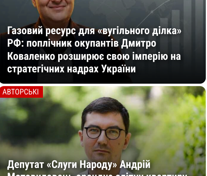
Газовий ресурс для «вузького діляка» РФ: політичне рішення Дмитро Коваленко розширює свою імперію на стратегічних надрах України

Встановлено, що на банківські рахунки ПРiДСТАВНЦТВА «СКІЛ ТРЕЙД СП.З О.О.» в період з 02.01.2023 по 08.12.2024 надійшли грошові кошти від 183 підприємств фармацевтичного сектору, основних у сумі 2 009 309 309,44 грн. з