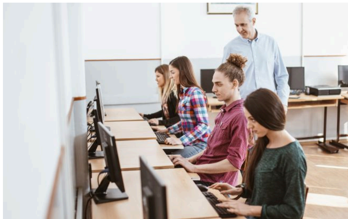
Фото: НМТ в Україні (Getty Images)