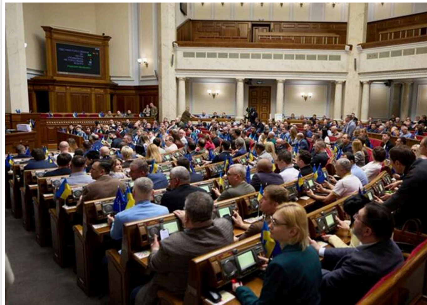
Вимога ЄС із поступками для кандидатів: парламент затвердив нові правила перевірки суддівських декларацій

Верховна Рада загалом підтримала законопроект №13165-2, який об'єднує декларації про добросовісність і родинні зв'язки суддів в один документ і закріплює порядок його перевірки.